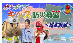
横浜市民防災センターのビデオなどで学びを深める